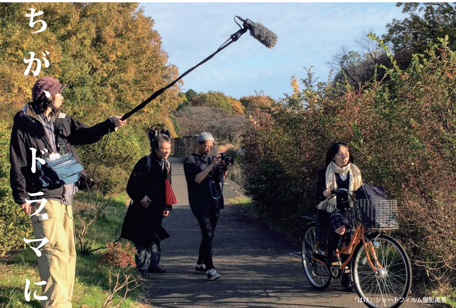
「はげ」ショートフィルム撮影風景